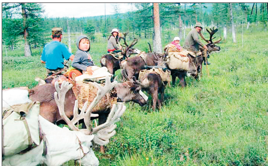
Рис. 1. Сойоты Восточного Саяна во время кочевки на летние пастбища.

Номадные этносы сохранили многие аспекты традиционного быта, в том числе опыт использования дикорастущих растений. Они хорошо знают о кормовых достоинствах трав, умеют использовать растения в лечебных целях, многие растения из местной флоры употребля-